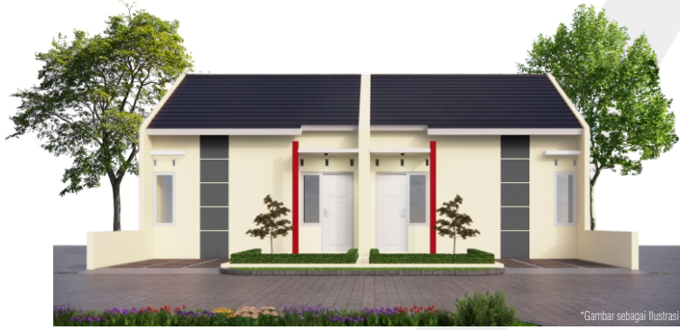
*Gambar sebagai ilustrasi