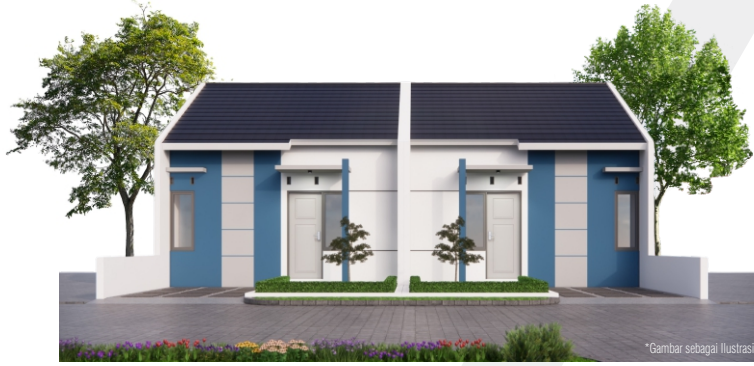
*Gambar sebagai ilustrasi