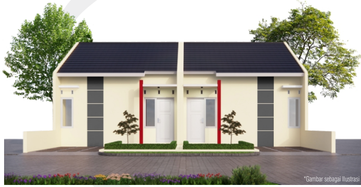
*Gambar sebagai ilustrasi